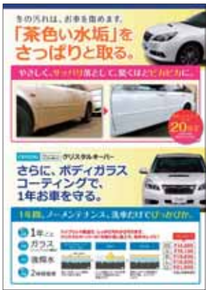
【水垢落とし+コーティングPOP】 消雪パイプ、融雪剤による「茶色い水垢」をスッキリ落としボディガラスコーティングを訴求します。