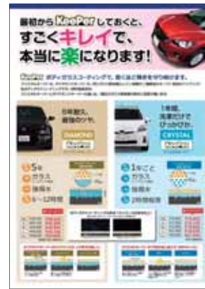
【ダイヤモンド&クリスタルキーパーPOP】 ダイヤモンドキーパーとクリスタルキーパー、2種類のボディガラスコーティングを訴求するPOPです。