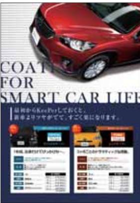
【クリスタル&ピュアキーパーPOP】 一番人気のクリスタルキーパーとロングセラーのピュアキーパーを訴求するPOPです。