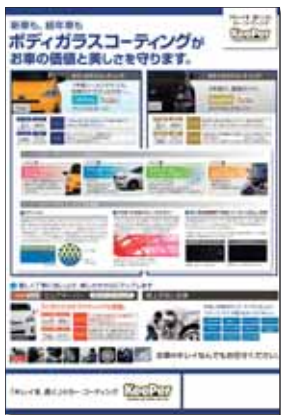
【キーパータイムズ号外チラシ(裏面)】 号外チラシの表面とあわせてお使いいただけるようボディガラスコーティングを訴求します。