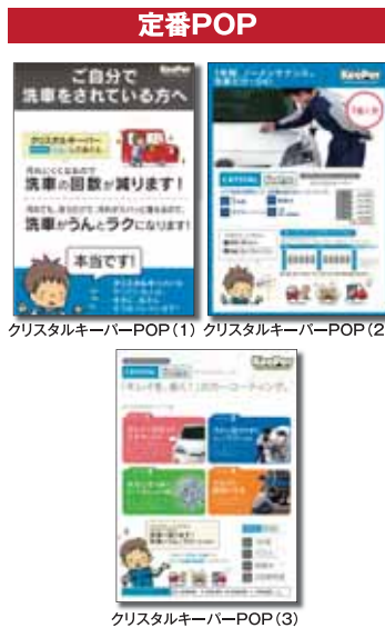
クリスタルキーパーPOP(1)