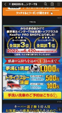
横浜港北インターTS公式LINE会員にクーポンを配布し、来店を促進した

ドライブスルー洗車のお客様へは、拭き上げスペースで「一部分コーティングのお試しができますよ」と声をかけます。お試し施工で手触り、ツヤ、水弾きを見て実感してもらった上で、関心を持っていただければ店内へ案内してメニュー表を使い説明を行います。繁忙期でも施工と同時進行でお試し施工と予約取りを行っていました。クーポンの使用状況を管理し、同じお客様へ重複して声かけしないように気をつけました。