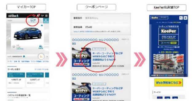
「マイカー」画面上のクーポンをクリックすると…

※連携についてのお問合せは、メールアドレス: web@itacgiken.co.jp でご案内いたします。また、各予約システム窓口をお願いいたします。