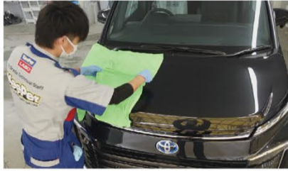
塗装にキーパークロスを敷き、70℃以上のお湯をかけて塗装表面温度を50℃以上にします。10～15分ほど蒸らし、キーパークロスを取ると花粉ジミがなくなっています。乾いたキーパークロスで拭き上げます。

塗装にキーパークロスを敷き、塗装表面温度を50℃以上にするために70℃程度の熱いお湯をかけ、10～15分蒸らせば、熱によってペクチンの組織が壊れ、塗装は元どおりにキレイになります。