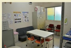
休憩室もすっきりしています