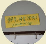
お見積書は宝物(こんな気持ちを持っているのですね)