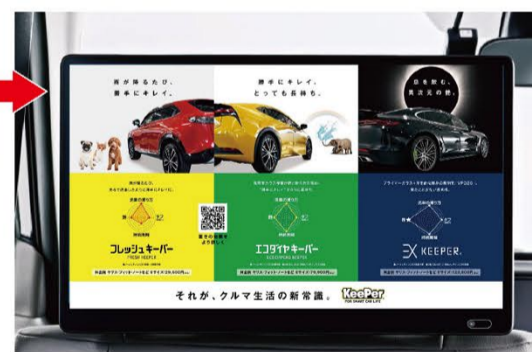
パネルタップで製品比較画面へ