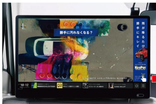
タクシーメディアでCM放映

タクシー利用者が乗車中の放映回数は、1ヶ月間合計で600万回超となり、100万人以上の方が複数回視聴されていると想定され、東京を中心に8月の新規のお客様のご来店が期待できます。