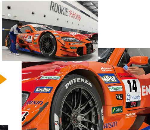
プライマーガラスの作業中

VP326の作業が終わるころには、元々ピカピカだった14号車が、EXキーパー独特のツヤを纏っており、毎日のように14号車を見ているであろう通りがかりのチームスタッフの方にも「おお…ツヤが凄い…」と仰っていただける仕上がりになりました。