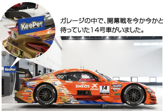
ガレージの中で、開幕戦を今か今かと待っていた14号車がいました。