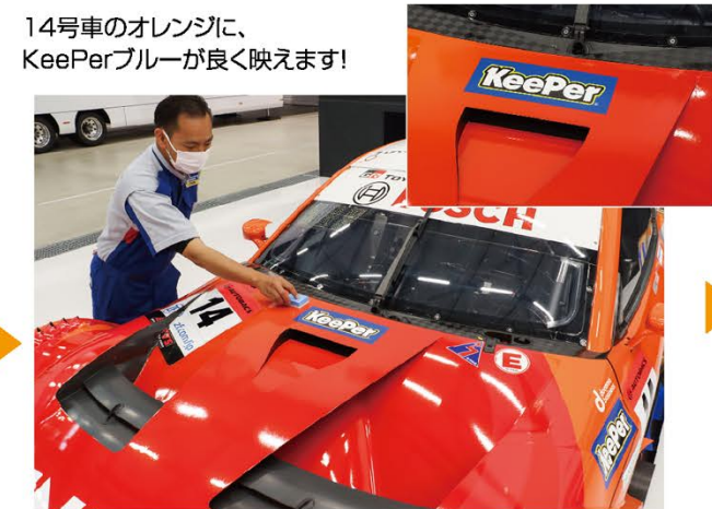
14号車のオレンジに、KeePerブルーが良く映えます!