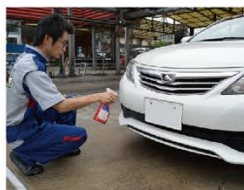
虫がよく付いている箇所は、フロント周り「フロントバンパー」「ボンネット前方」「左右ドアミラー」「フロントガラス(見落としがち)」です。

その後の洗車でふやけた虫がよく取れるので、洗車の品質向上だけでなく、作業効率も良くなります(洗車後に多少残った虫も最終拭き上げにマイクロファイバークロスを使用することで容易に拭き取れます)。