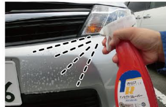
コーティングを傷めないインセクトリムーバーの仕組み

一般的な虫取り剤は、虫に対する分解能力が高い洗剤を選択します。そのため虫だけでなく、コーティングに対する分解能力も高く、虫と同時に、ボディやガラス面に施工されているコーティングを分解してしまいます。インセクトリムーバーは、特殊な「浸透剤」によって、虫に水を強力に浸透させ「ふやかして」虫を取りやすくするので、ボディやガラス面のコーティング剤を落としません。