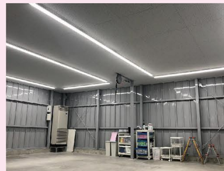
完成形。快適な環境で品質を保ちましょう！