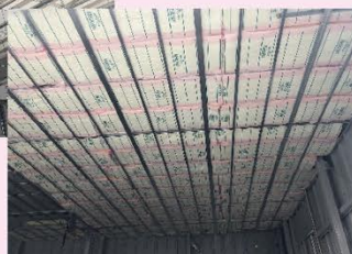
天井内グラスウール充填