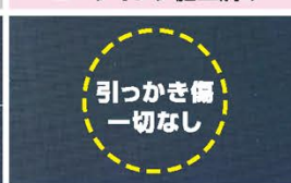
傷が全くついてない