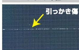
引っかき傷がついた