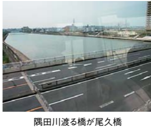
隅田川渡る橋が尾久橋

足立区の東部は、東武鉄道伊勢崎線という幹線鉄道が縦貫しており、ターミナル浅草はもとより、野井・日本橋・墨堤・新橋・洗谷・大手町・永田町など、東武線と相互乗り入れする地下鉄によって乗り換え無しで都心に直結する便利な地域ですが、西部は、首都圏の放射状鉄道ネットワークの狭間にはさまれて、この地域の人は、通勤先や通学先の場所によって、東武鉄道の竹ノ塚駅や西新井駅、あるいはJR京浜東北線の、埼玉方面にある川口駅まで、バスで二十三分をかけて乗り継ぐか、あるいは道路は都心に一直線に伸びていますが、そこを走る都営バスに乗って、渋滞混雑で何十分かかる見込みがつかない通勤通学を迫られていたわけです。なにも、都心からこの地域まで二つの川を渡る必要は、というよりは必然的に発生する橋渡しの覚悟しなければならぬ。それを何とかしようと計画されたのが地下鉄の延伸でしたが、ご案内のように地下鉄建設には膨大な経費がかかります。じゃあ高架鉄道はどうかなと、あ