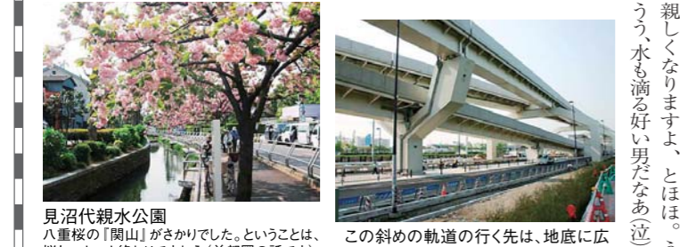
見沼代親水公園 八重桜の「蘭山」がさかきだ。ということ、桜もいよいよ終わりですねえ(首都圏の話です)

実際に運行されている都営300系という車両は、全長9メートルの形に5両連結して編成、各車両110kWのモーターを搭載し、制御方式はVVVFインバーター制御の三相交流モーターです。つまり、小さく効率的なモーターの力を最大に発揮できる制御システムとゴムタイヤの組み合わせでこれらの諸問題が解決できるわけです。それは加速と登坂性能に現れます。加速度は3.00系は3.5km/h/s、最速の新幹線J500形は1.92km/h/sです。最高速度は300km/hと圧倒的な差がありますが、乱暴に言えば低速トルクが太いか高回転域のパワーが大きい、という車の特性みたいなものと考えられるのではないのでしょうか。300系のおかげで、日暮里から