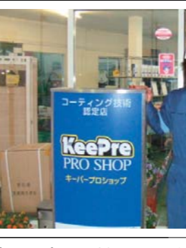
大西株式会社 奈良長良店SS

倉敷駅の北側を走る片側二車線の大きな国道に面した場所にある赤澤屋(株)セルフ倉敷インター店は、セルフ改装から丁度一年が経過しました。キーパーを始めたのは10年前、自己流となっていたキーパーをもう一度原点に戻って見直すため、昨年、再度研修を受講。それによって技術面、知識面共に自信を持ってお客様に提案が出来るようになったそうです。「お客様は車をキレイにしたいと思ってる。その思いを叶えられる商品だ」とスタッフ全員がキーパーを信頼しています。仕上がりにもこだわりを持ち、仕上がりが確認時には必ず「きれいな車になりましたね」とお客様に問いかけ満足度を上げるように工夫しています。