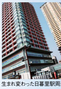
生まれ変わった日暮里駅周辺

去る三月三十日、東京都荒川区のJR山手線日暮里(つばし)駅と、二十三区でありながら鉄道通過地であった足立区西部を直結する都営新交通システム「日暮里・舎人ライナー」が開業しました。