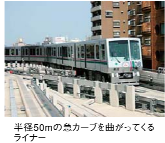
半径50mの急カーブを曲がってくるライナー

法律上は鉄道ですが、「新交通システム」にはレールがありません。鉄道の線路にあたる部分はコンクリートの平面です。でも、車両はバスではなく、短い電車で、日暮里・舎人ライナーは五両編成で走っています。鉄道の代わりには、線路の代わりに、壁面に設置した案内軌条(ガイドレール)に、車輪とは直角に付いている誘導車輪が進行の決定と安定した走行を確保する仕組みです。